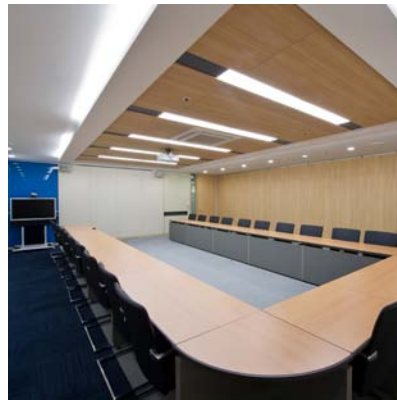
Endress+Hauser Korea meeting room CCMM bldg 10F