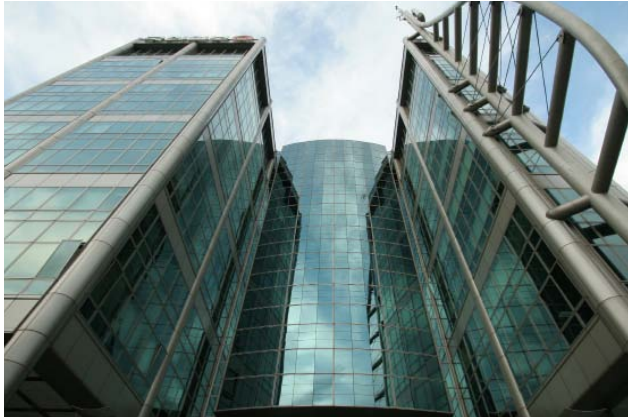
CCMM Building Yeouigongwon-ro, Yeongdeungpo-gu, Seoul, Korea