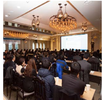
Convention Hall, Seoul City Club CCMM bldg 12F